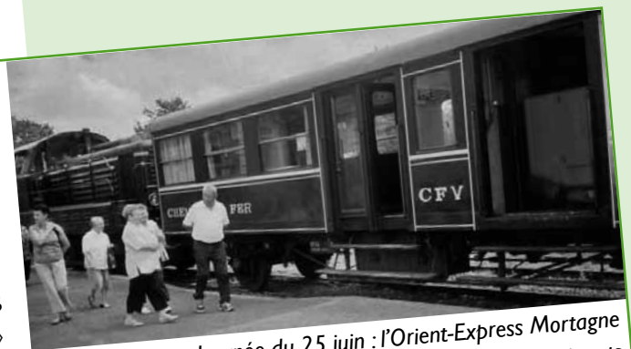
Journée du 25 juin : l'Orient-Express Mortagne Les Herbiers - 36 participants