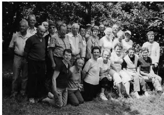
(pique nique à l'aire « Saint André » à Saint Aubin des Ormeaux)

Le retour à Bazoges est aux environs de 17h30. Toutes les randonnées se terminent par une boisson chaude (ou autre). Courant juin, un pique-nique est organisé ou sont invités les conjoints(es) des marcheurs : la matinée, marche et l'après-midi jeu de cartes, palets et pour les plus courageux une autre marche.